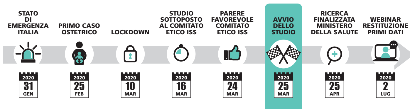
Figura 1. Cronologia del progetto. Figure 1. Timeline of the project.

Per la stima preliminare dei tassi d'incidenza sono state considerate al numeratore le donne con una diagnosi d'infezione da SARS-CoV-2 e che hanno partorito nei PN italiani tra il 25.02.2020 e il 22.04.2020 e al denominatore il numero di parti totali nello stesso periodo, stimato a partire dai dati dei Certificati di assistenza al parto (CeDAP) relativi al 2018, 20 ipotizzando una distribuzione annua uniforme e una riduzione annua delle nascite pari allo 0,3%. I tassi d'incidenza dell'infezione da SARS-CoV-2 nelle donne che partoriscono e i relativi intervalli di confidenza al 95% (IC95%) sono stati stimati a livello nazionale, per area geografica e per la Regione Lombardia.